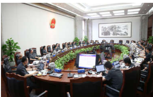
最高人民法院审判委员会全体会议现场。